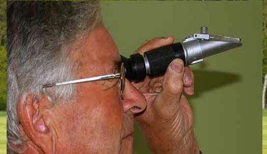
Die Bestimmung des Zuckergehalts im Frischgras erleichtert die Auswahl des passenden Siliermittels und erhöht den Siliererfolg. Bei hohem Zuckergehalt ist der Einsatz von Bonsilage Fit G ideal.